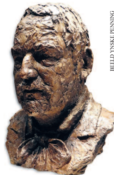
BEELD YNSKE PENNING